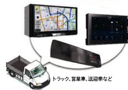
トラック、営業車、送迎車など