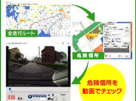
危険箇所を 動画でチェック