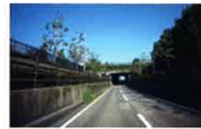
画面隅の隅もクリア