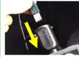
フロントガラスに 貼付け時