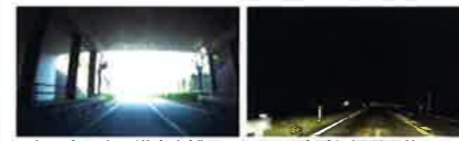
トンネル出口逆光を補正